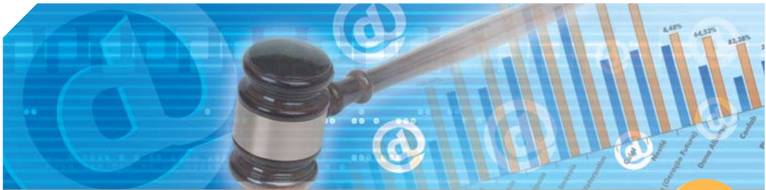
GRÁFICO DE RENTABILIDADE - LEILÕES PRESENCIAL E ON-LINE